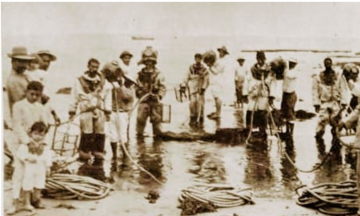
Buscadores de perlas preparándose para el trabajo.- Tomada del libro "Manabí a la vista" Juan B. Ceriola, 1913.